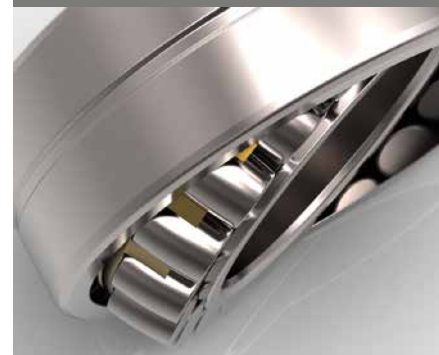
Spherical Roller Bearings