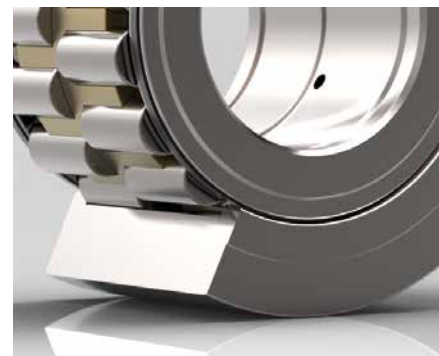
Support Roller Bearings

KRW – Your authentic partner for steel industry